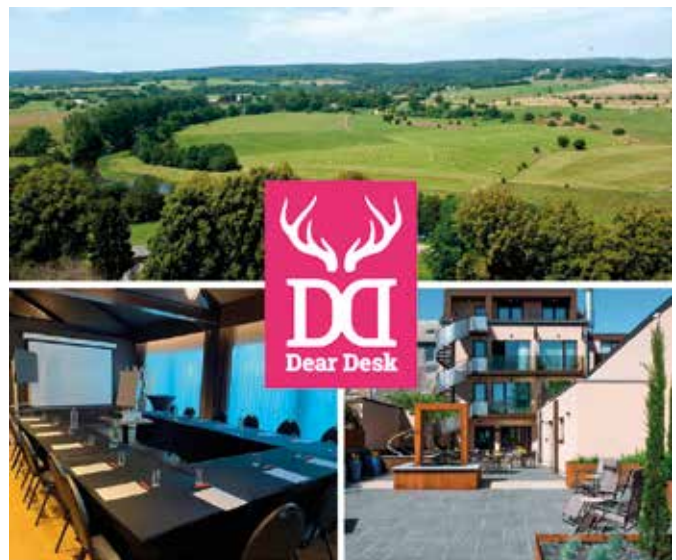
Le Florentin à Florenville

Florentin, à Florenville, La Claire Fontaine, à La Roche-en-Ardenne, les Myrtilles, à Vielsalm et Le Parc Tiers-lieu, à Rossignol - ont donc imaginé ce projet original révolutionnant le télétravail.