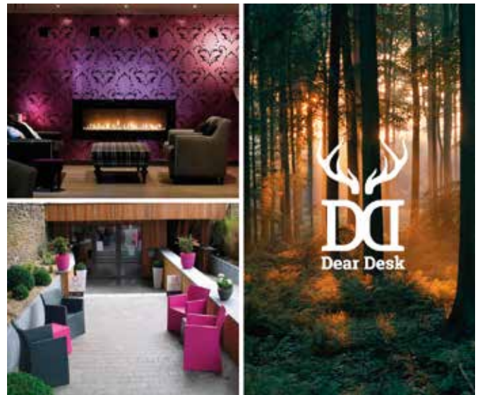
Les Myrtilles à Vielsalm

En tant qu'entrepreneur, vous qui nous lisez, vous serez certainement attentif à cette offre originale qui peut rencontrer vos besoins