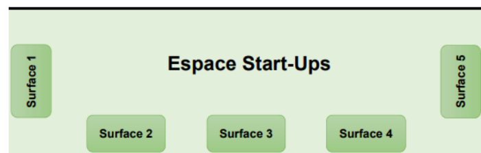
Configuration de l'îlot Start-Up de 12m 2

L'emplacement du Pavillon Gourmet au sein du salon sera communiqué ultérieurement.