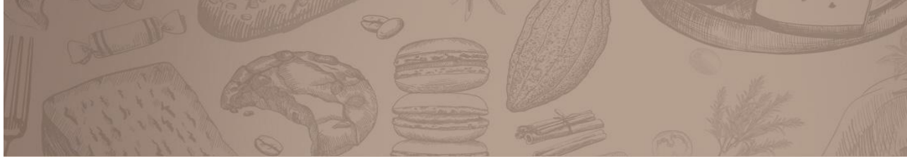
Illustration des différents îlots du Pavillon Gourmet :